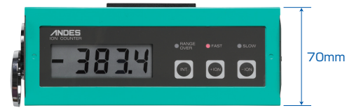
簡単操作、見やすい大型ディスプレイ