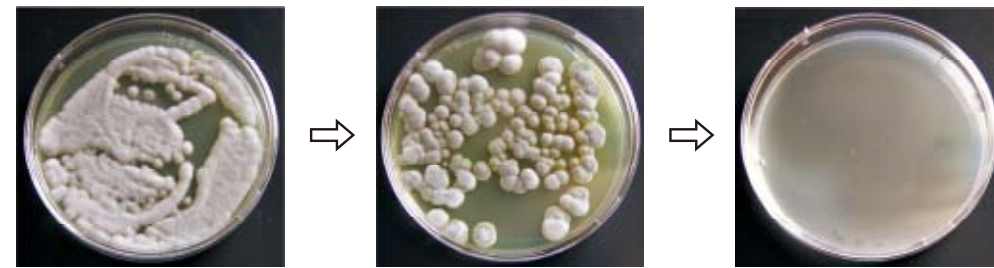
初期 → 5分後 → 15分後 アオカビ (培養後の培地写真)