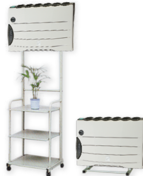
AD-1 ¥38,500 (税別) (H2,060 × W525 × D460) AT-2 ¥13,800 (税別) (H505 × W425 × D360)

オプションスタンド AT-2 ¥13,800 (税別) AD-1 ¥38,500 (税別)