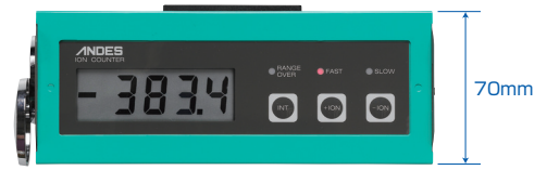
簡単操作、見やすい大型ディスプレイ